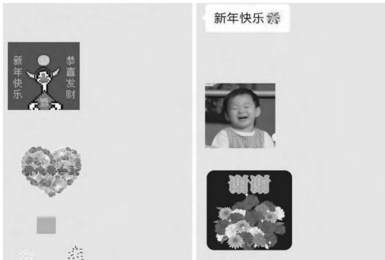
图3 00后群体模仿使用“中老年”表情包拜年

跨圈层与同圈层两类迎合行为性质具有一定差别，主要体现在对“中老年”表情包文化意义的编码与解码路径上。与跨圈层迎合性对话不同的是，用于同圈对话的“中老年”表情包的使用更需要打通圈层内部认同性，为完成迎合性、正向表述目的。跨圈层传播的符号编码基本停留在“中老年”表情包的情绪表层，而本研究发现，网生代使用的“中老年”表情包，更注重对表情包中的鲜艳的色彩、保守的表述或中国风的符号等审美符号进行标出，进而对其意义拼接、解构与重构。因此，同圈层传播需要在编码和解码的过程中，实现使用者和接收者对表达不同符号拼接重构的相同内部认同效果，也是对传播对象的同圈层内部认同的体现。此外，由于“中老年”表情包通常由具有显著表意价值的符号组成，在网络表达上具有强感染力，对“00后”圈层而言极具标出性，在同圈社交过程中更容易引起圈层内部重复模仿使用“中老年”表情包的行为，形成圈层对话模因（图3），而参与的频次等可以作为该圈层连接强度的参数。