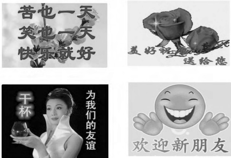
图1 “中老年”表情包案例

播,本研究探讨网生代圈层符号的建构与传播模式、特点、机制等,为讨论当前区域社会、代际变化和身份调整等问题提供了传播学视角的解读。