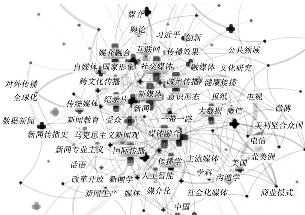
图 2 新闻传播学 4 种代表性期刊的主题图谱